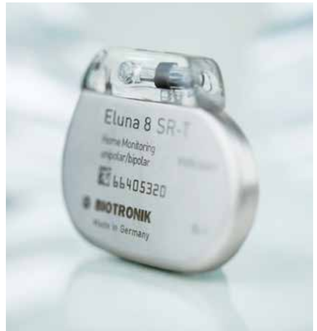
Herzschrittmacher haben einen Durchmesser von drei bis fünf Zentimetern. Es gibt sie von verschiedenen Herstellern