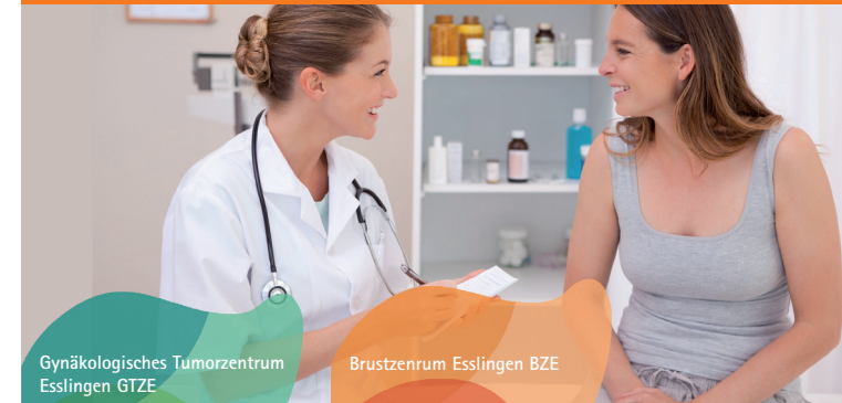
Gynäkologisches Tumorzentrum Esslingen GTZE